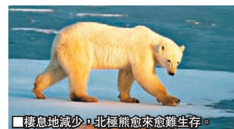
棲息地減少，北極熊愈來愈難生存。